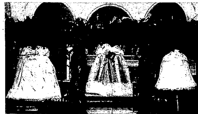
Inauguration des cloches 1926 (voir rubrique "notre histoire")