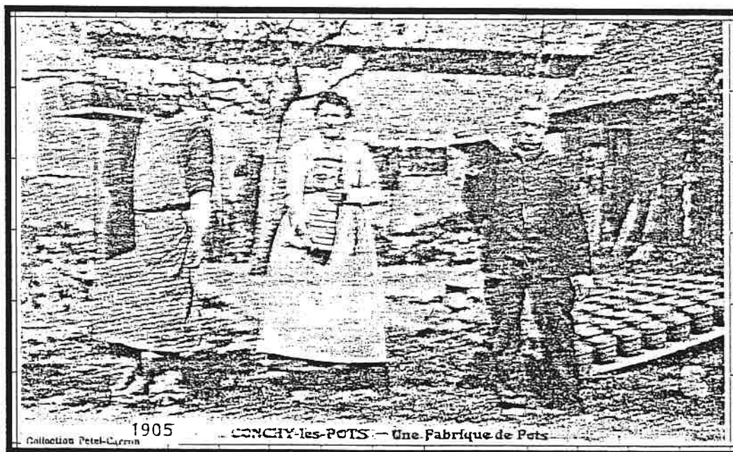
Photographie ancienne de Conchy-les-pots certainement située rue de la poterie....